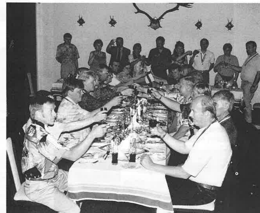
Malja hyväille menestykselle koko ryhmän voimin.